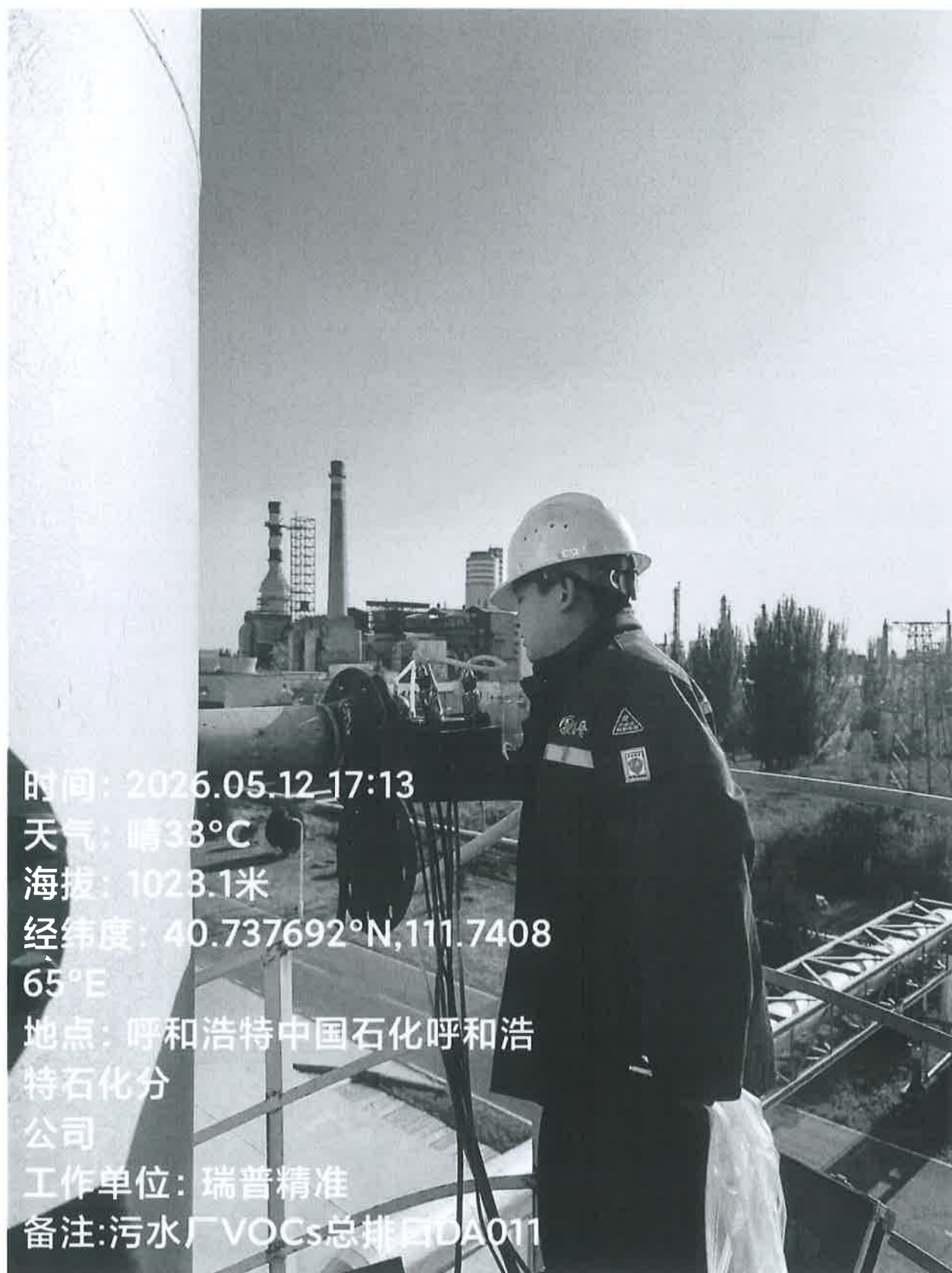
图 1 污水处理厂 VOC 总排口采样点位照片