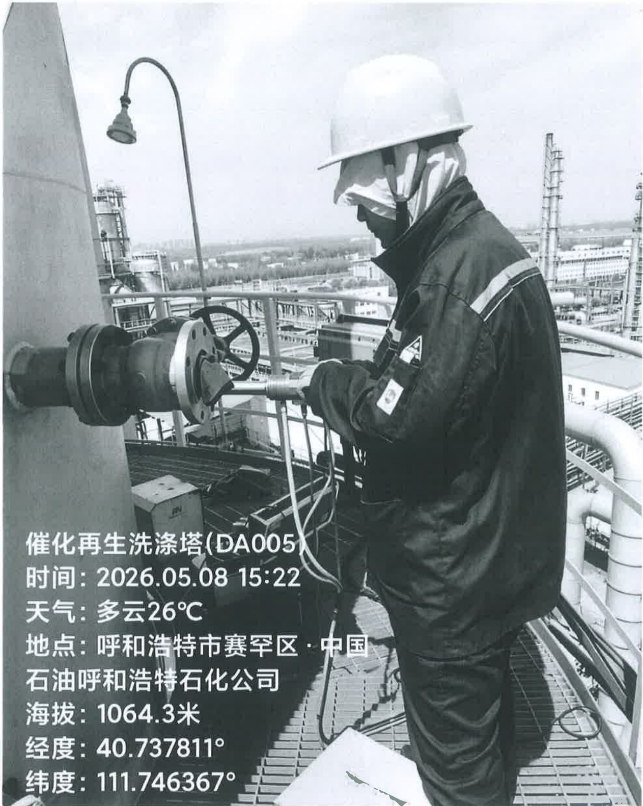
图 1 采样点位照片