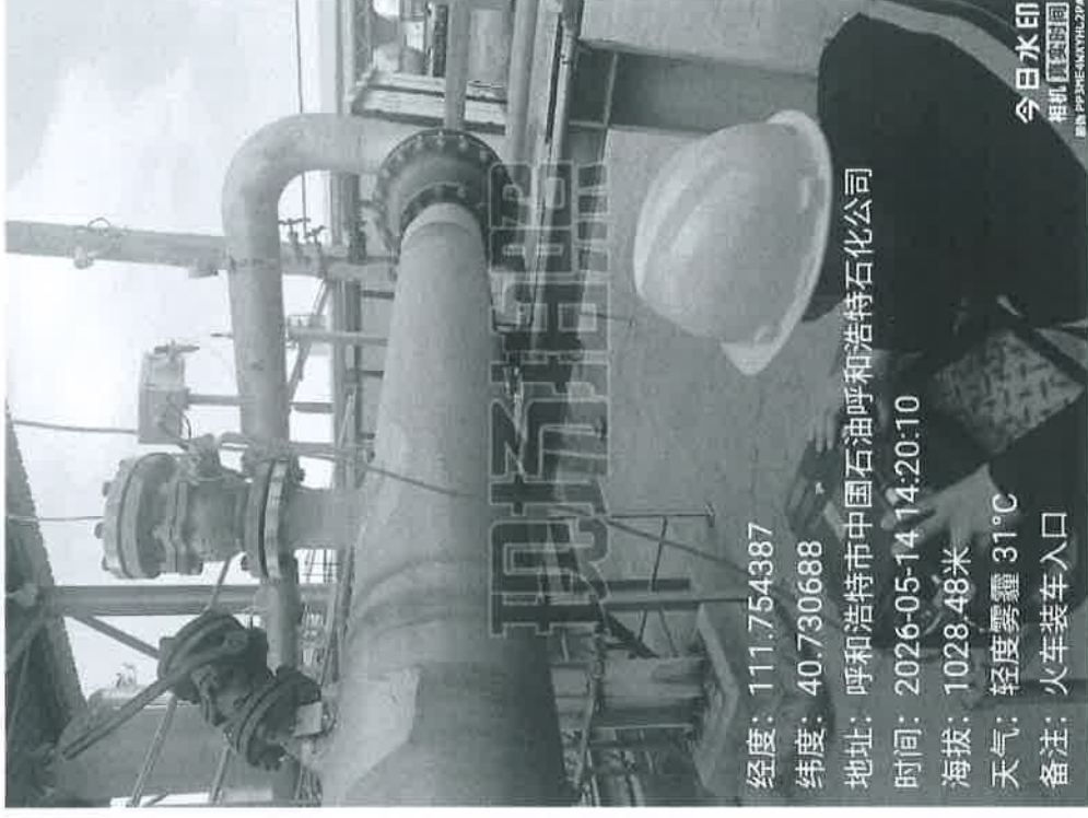
图 1 采样点位照片