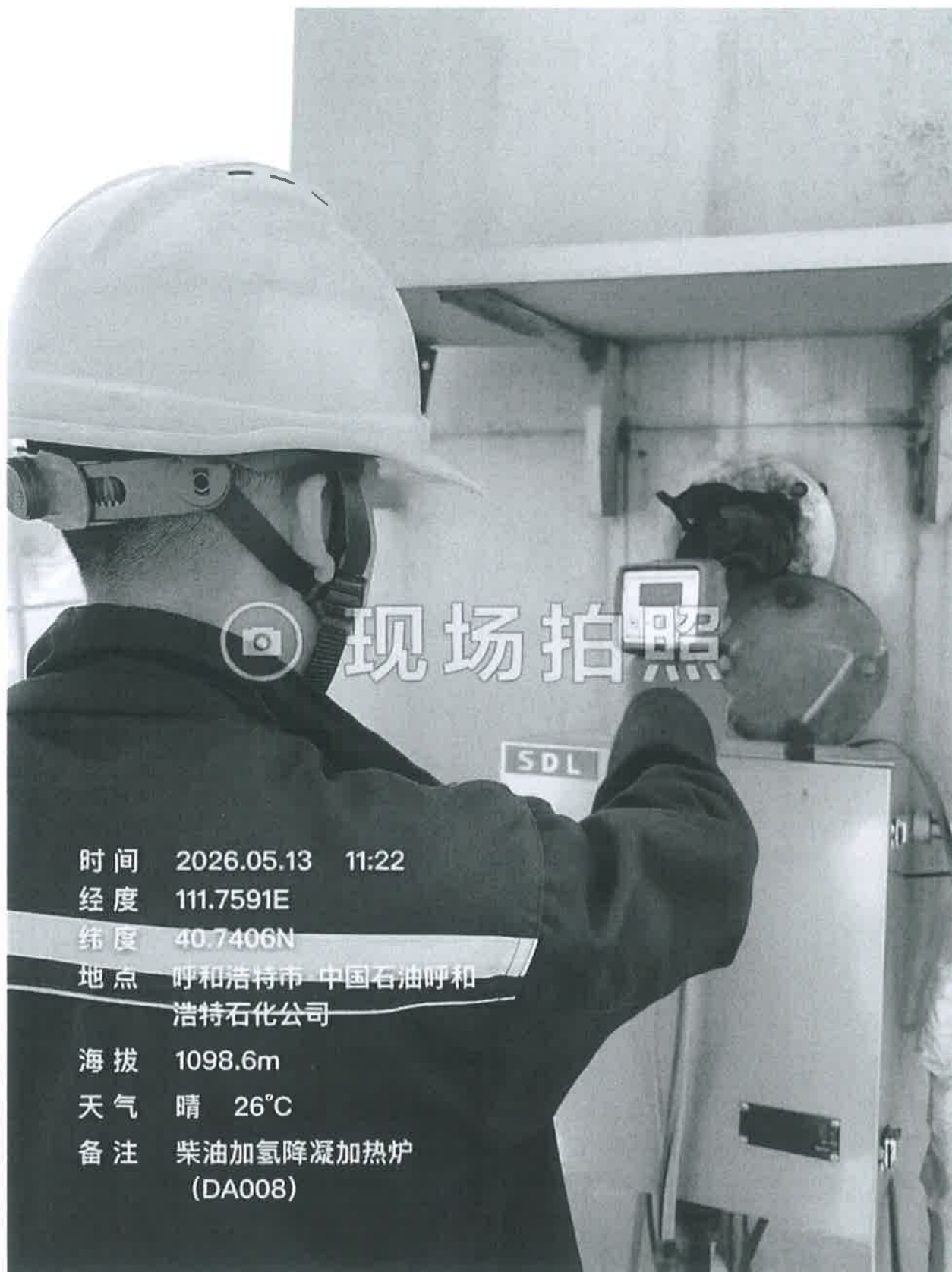
图 1 采样点位照片