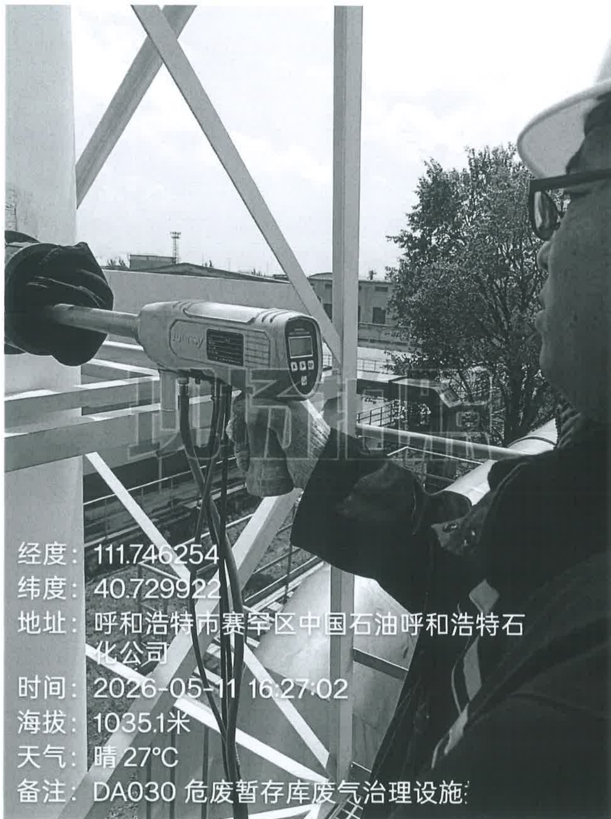
图 1 危废库废气治理设施排放口采样点位照片