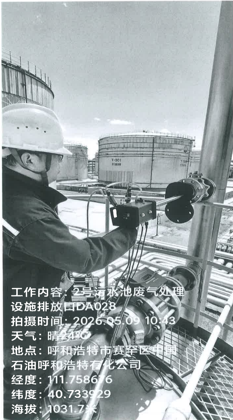
图 1 2#污水池废气处理设施排放口采样点位照片