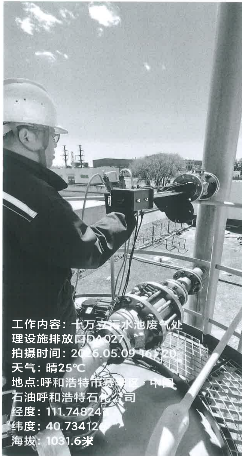
图1 10万立污水池废气处理设施排放口采样点位照片