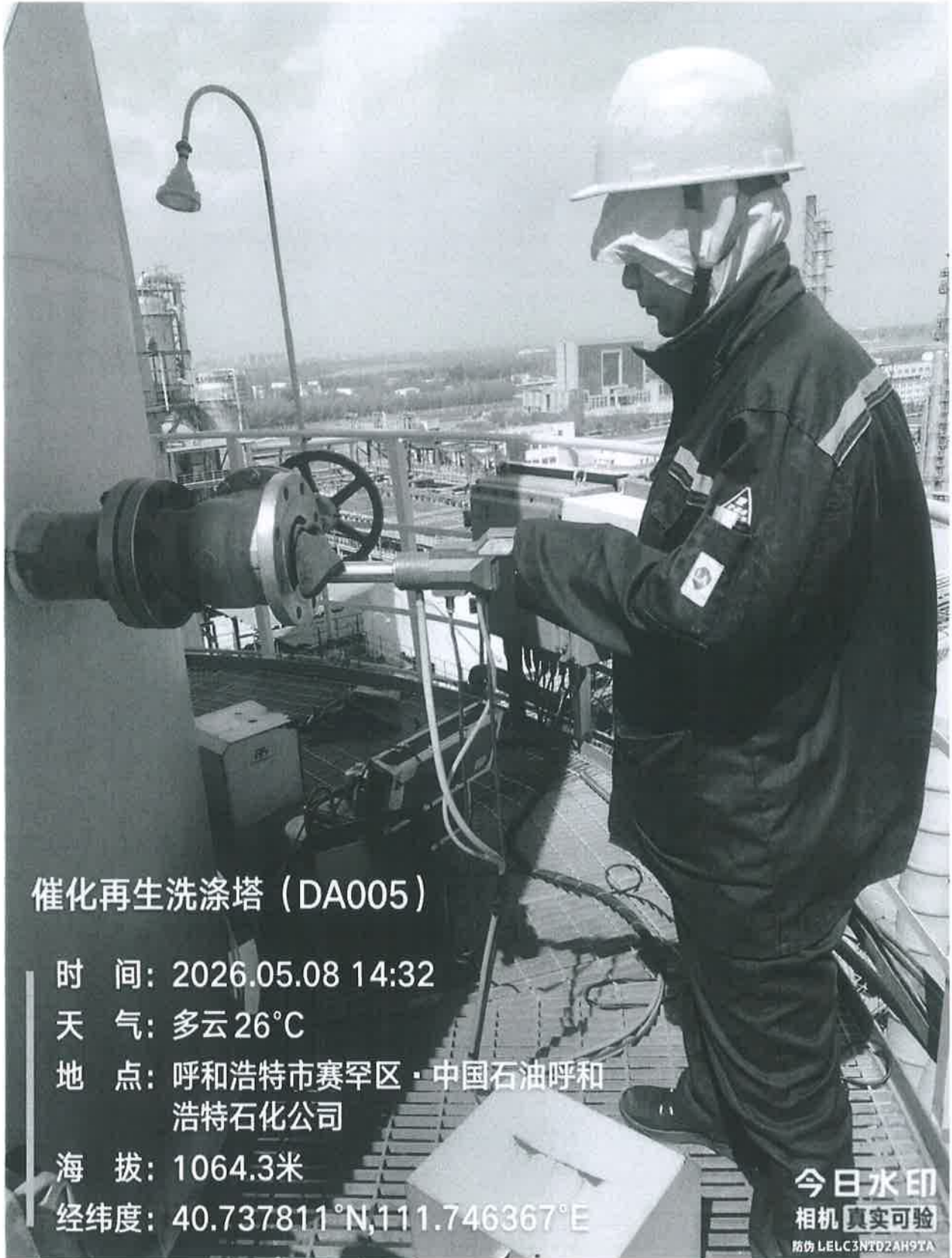
图 1 采样点位照片