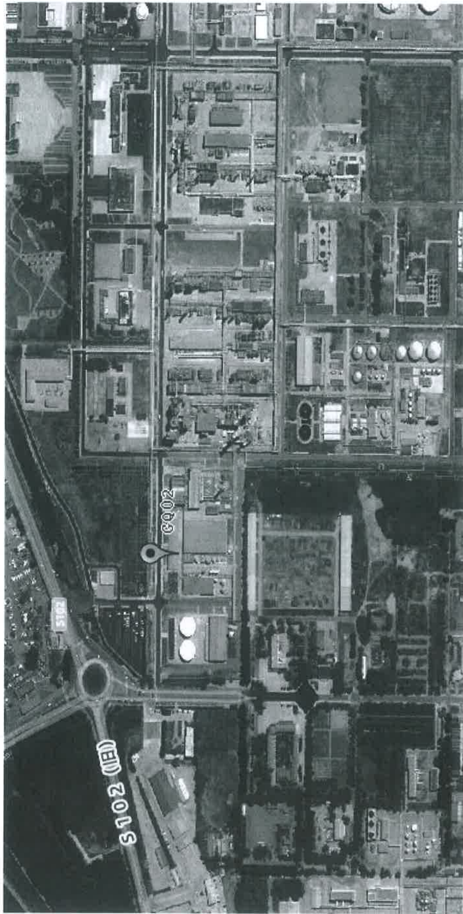
图 2 检测点位示意图