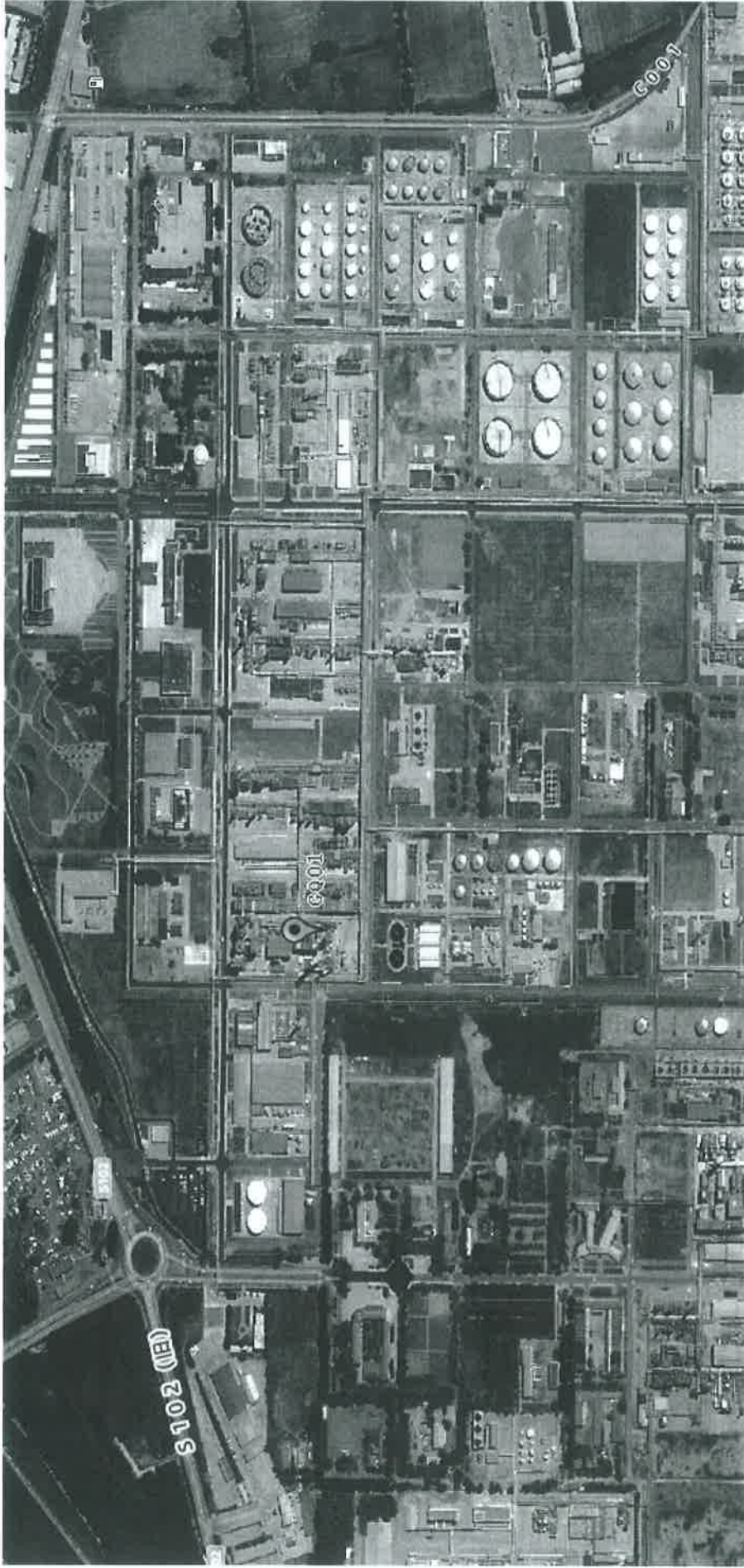
图 2 检测点位示意图