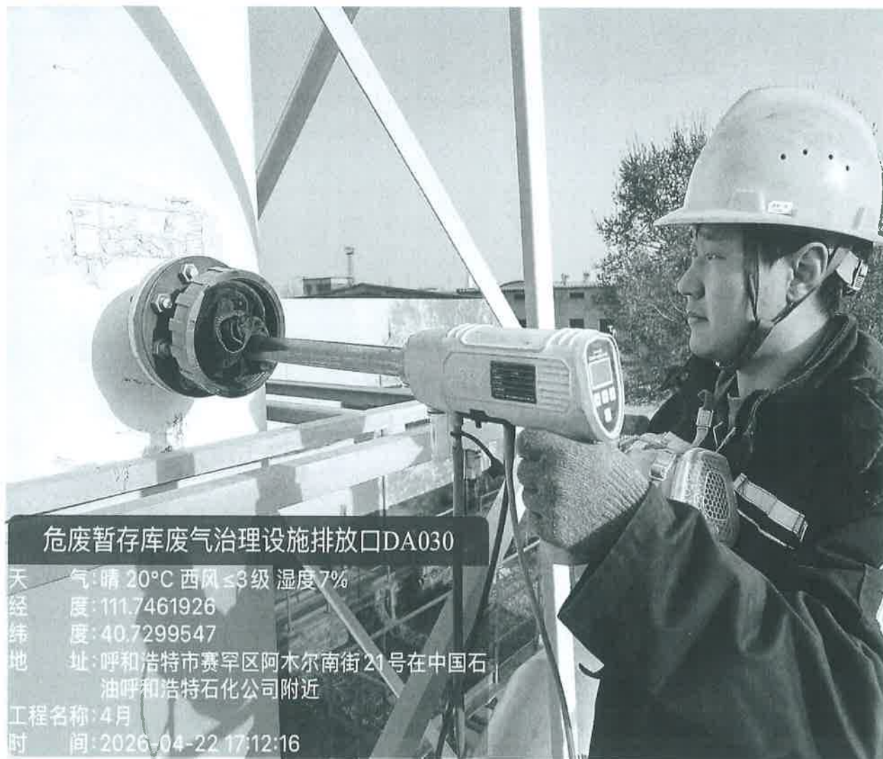
图 1 危废库废气治理设施排放口采样点位照片