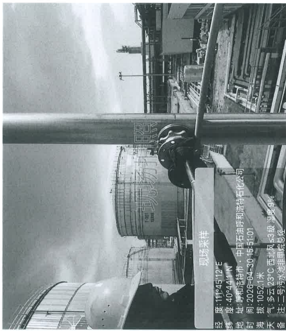
图 1 2#污水池废气处理设施排放口采样点位照片