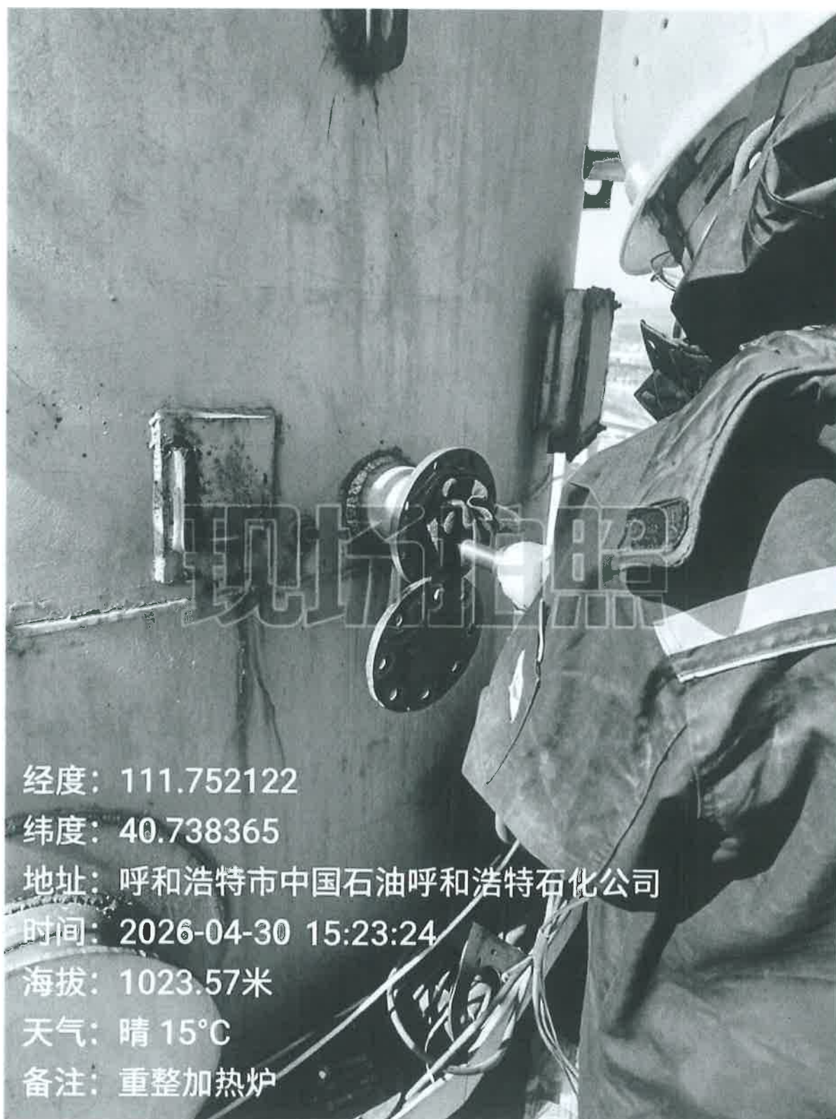
图 1 采样点位照片