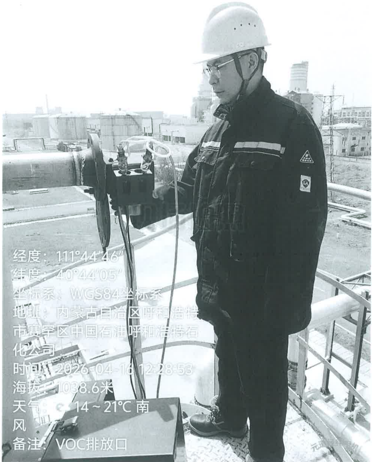
图1 VOC总排口采样点位照片