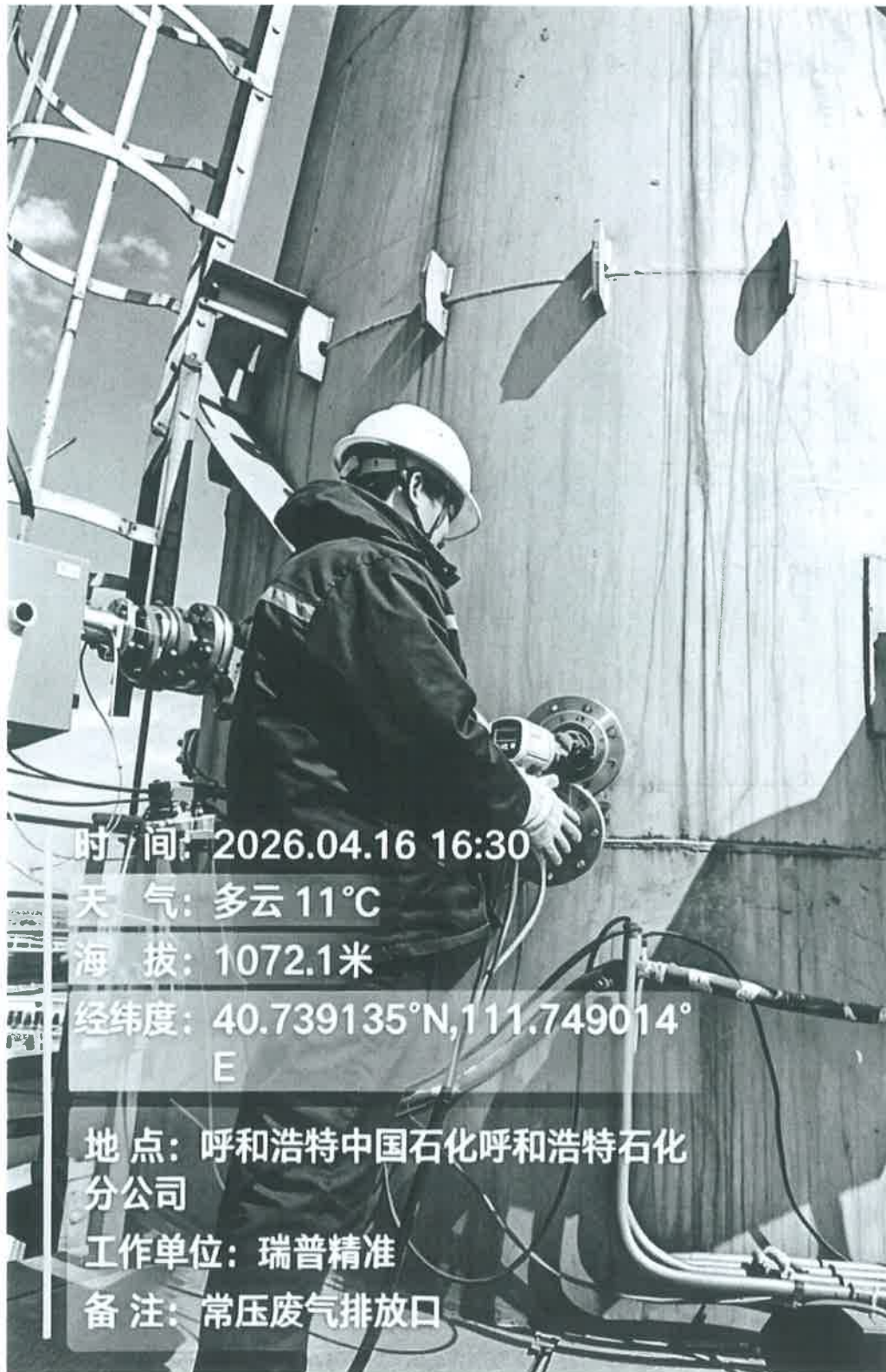
图 1 采样点位照片