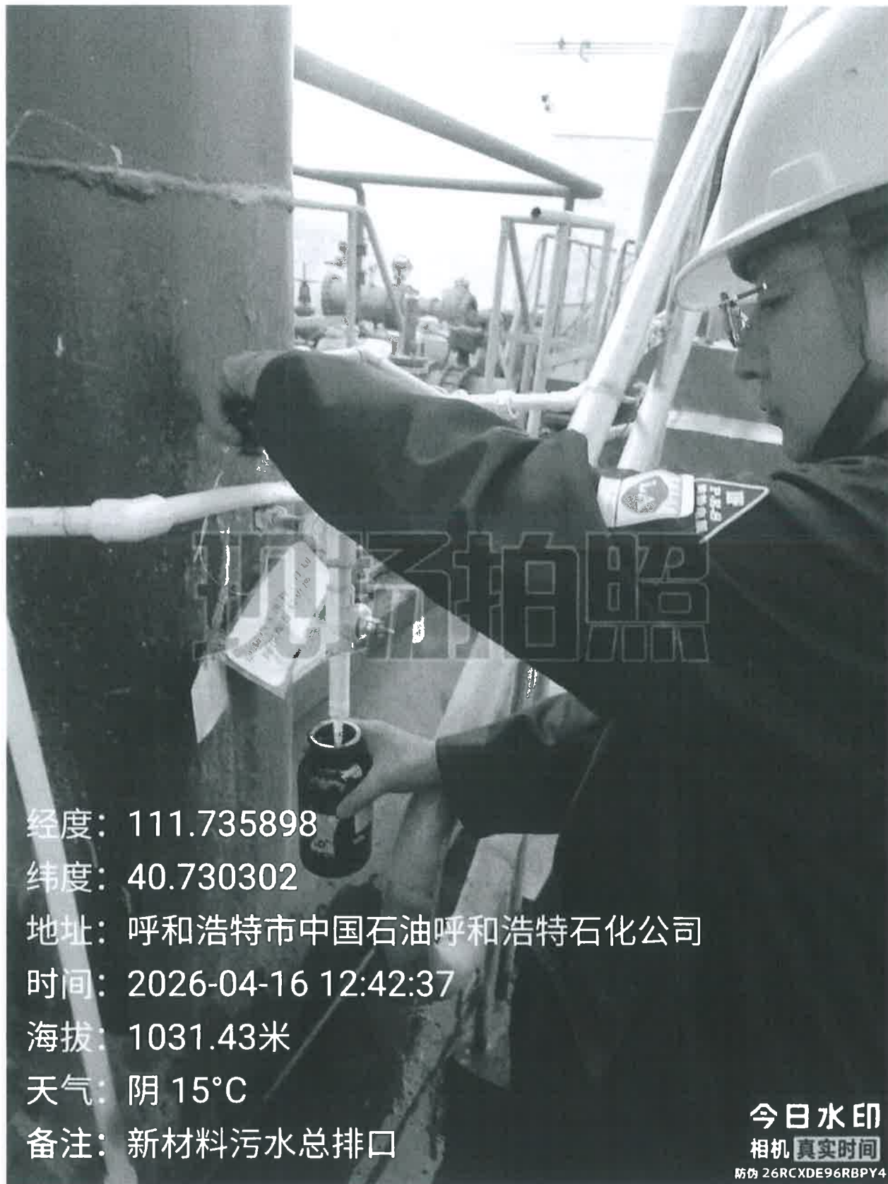
图 1 检测采样点位照片