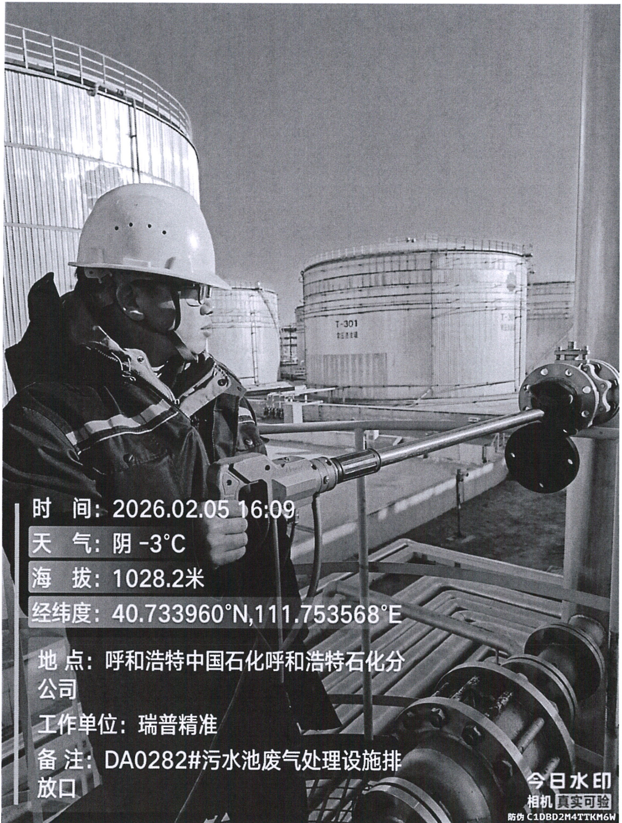
图 1 2#污水池废气处理设施排放口采样点位照片