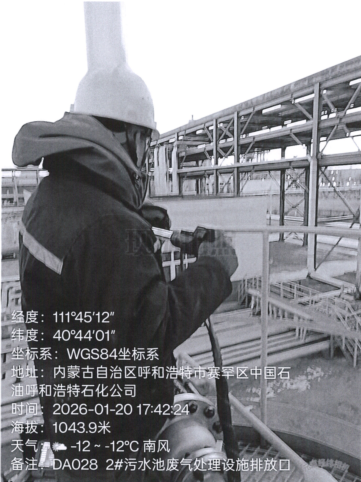
图 1 2#污水池废气处理设施排放口采样点位照片