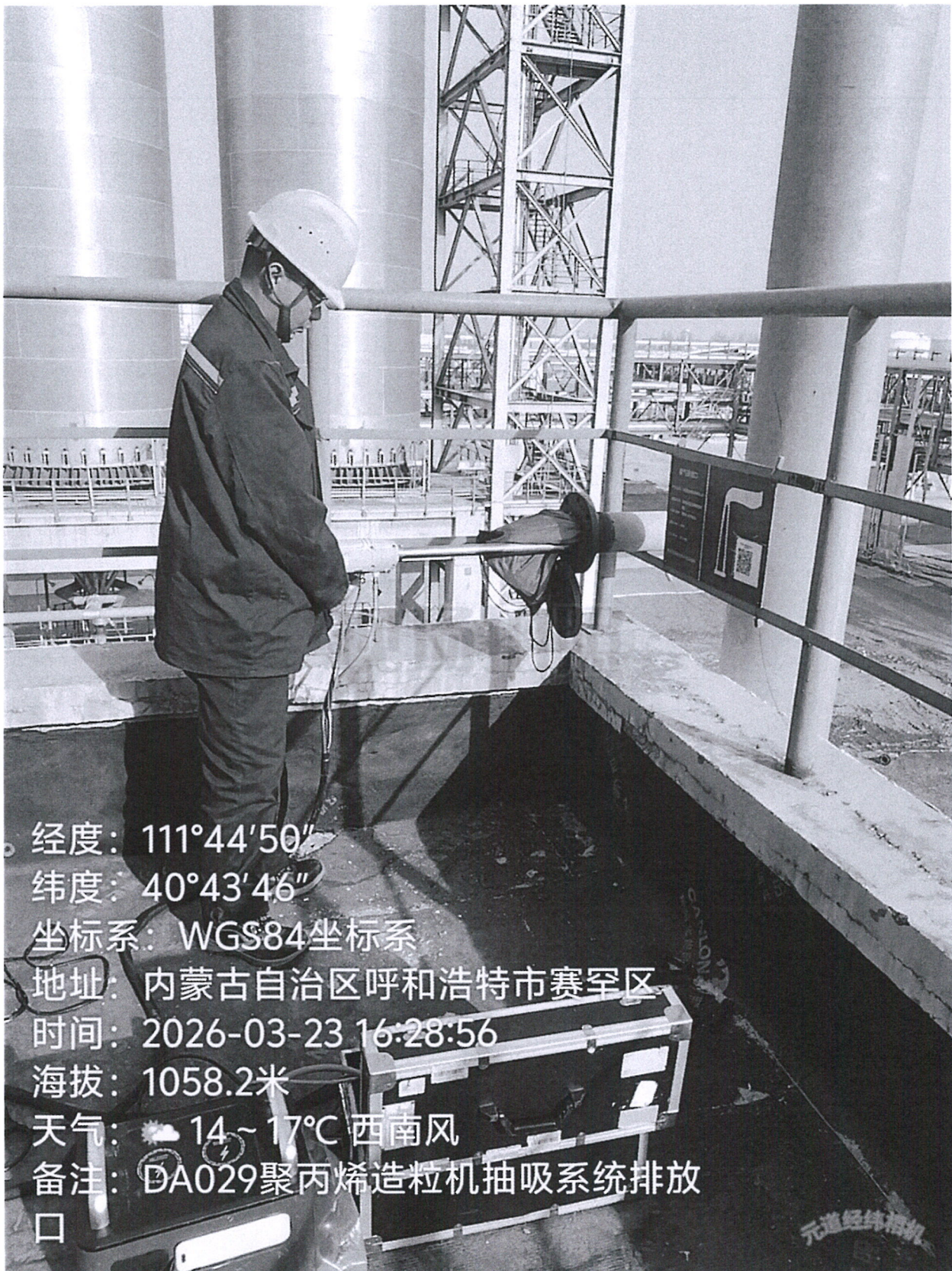
图 1 聚丙烯造粒机抽吸系统点位照片