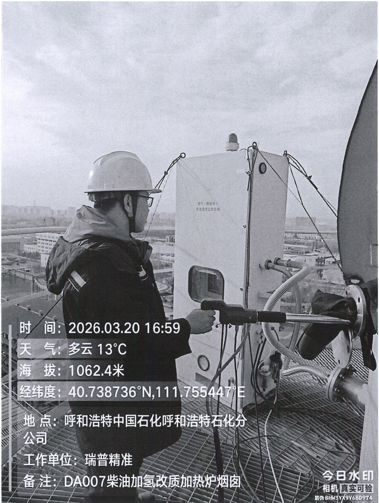
图 1 采样点位照片