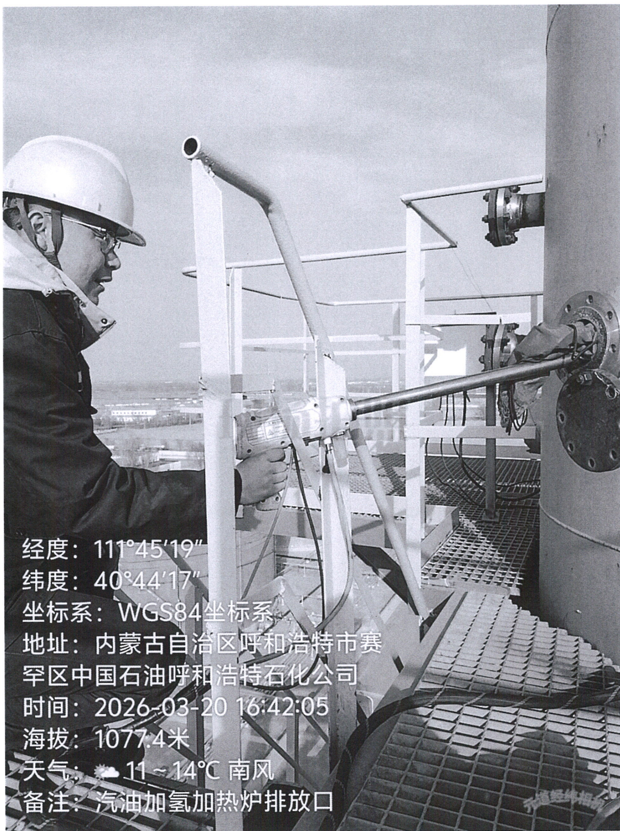
图 1 采样点位照片