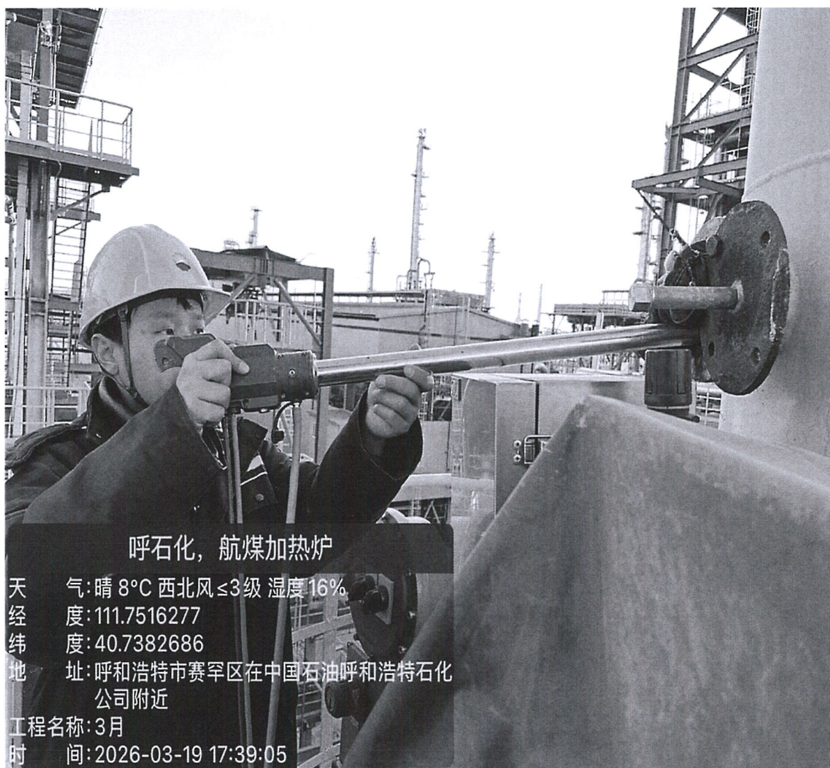
图 1 采样点位照片