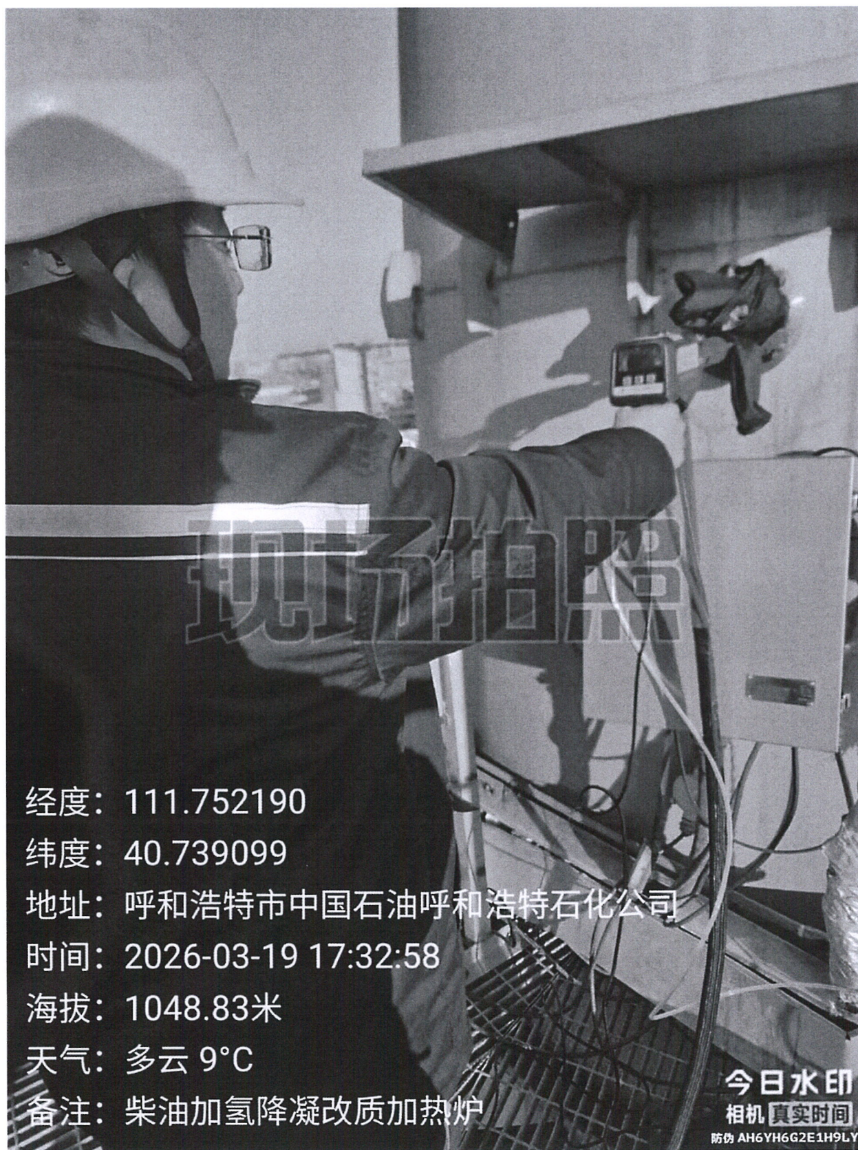
图 1 采样点位照片