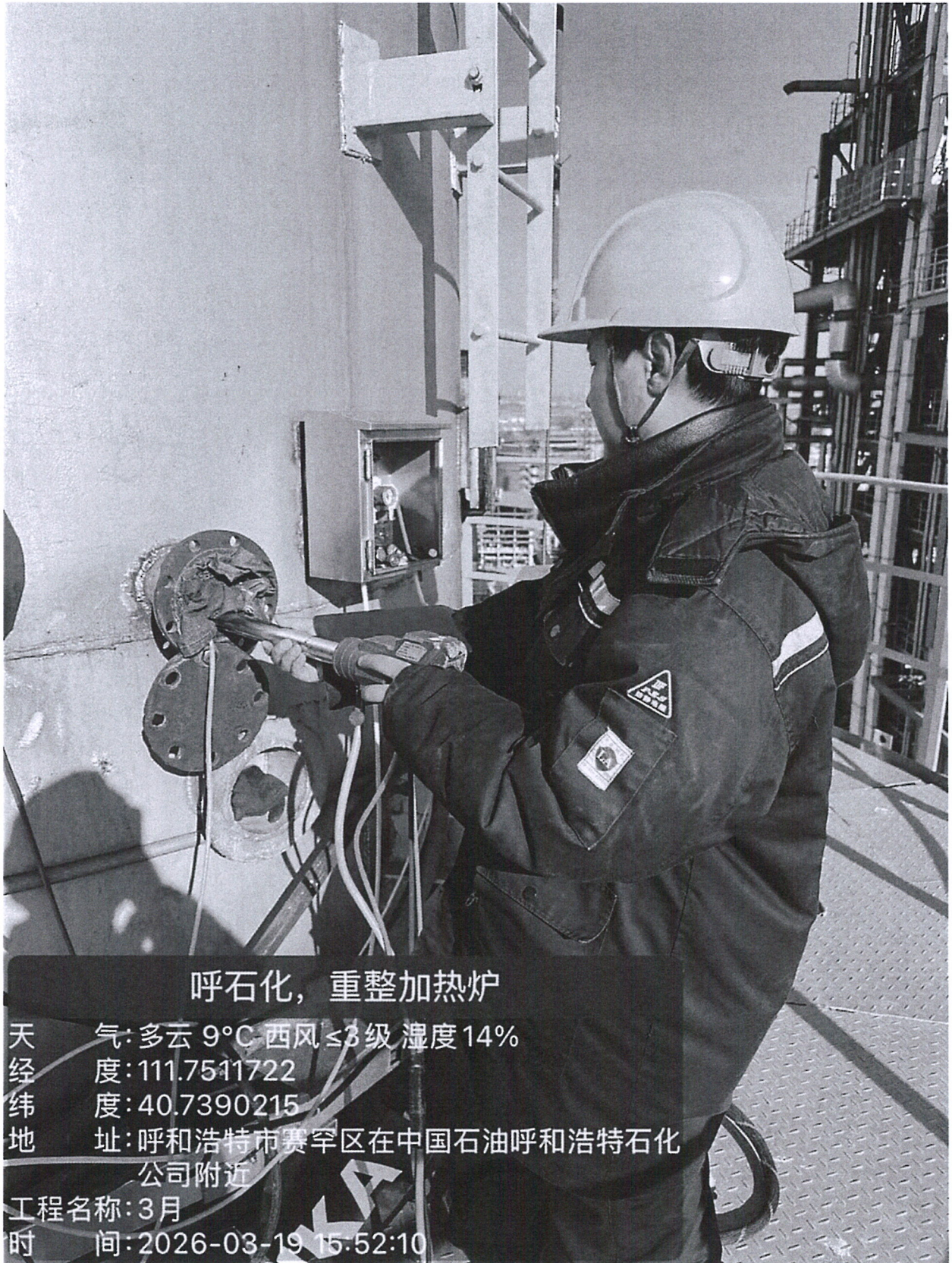
图 1 采样点位照片