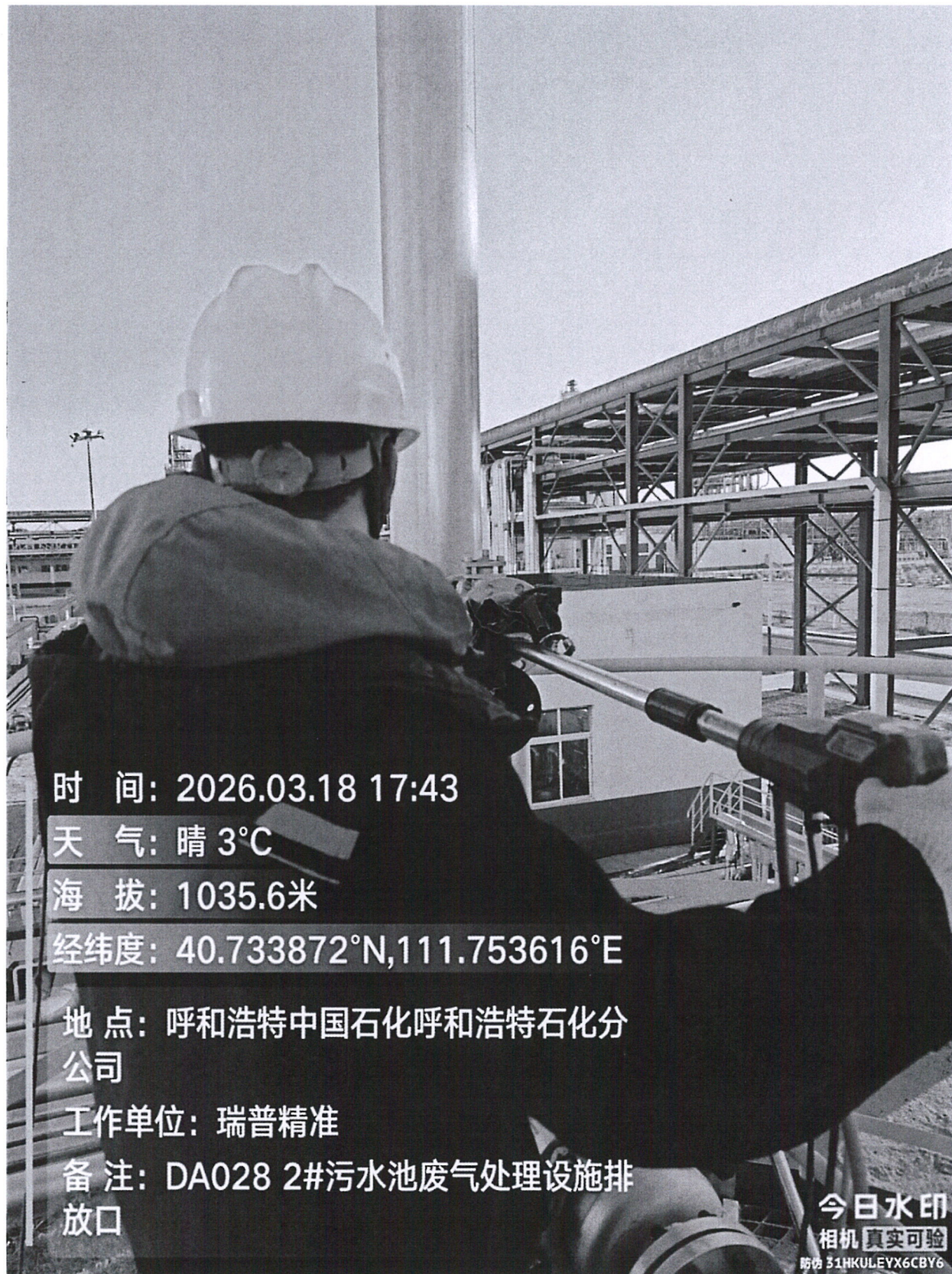
图 1 2#污水池废气处理设施排放口采样点位照片