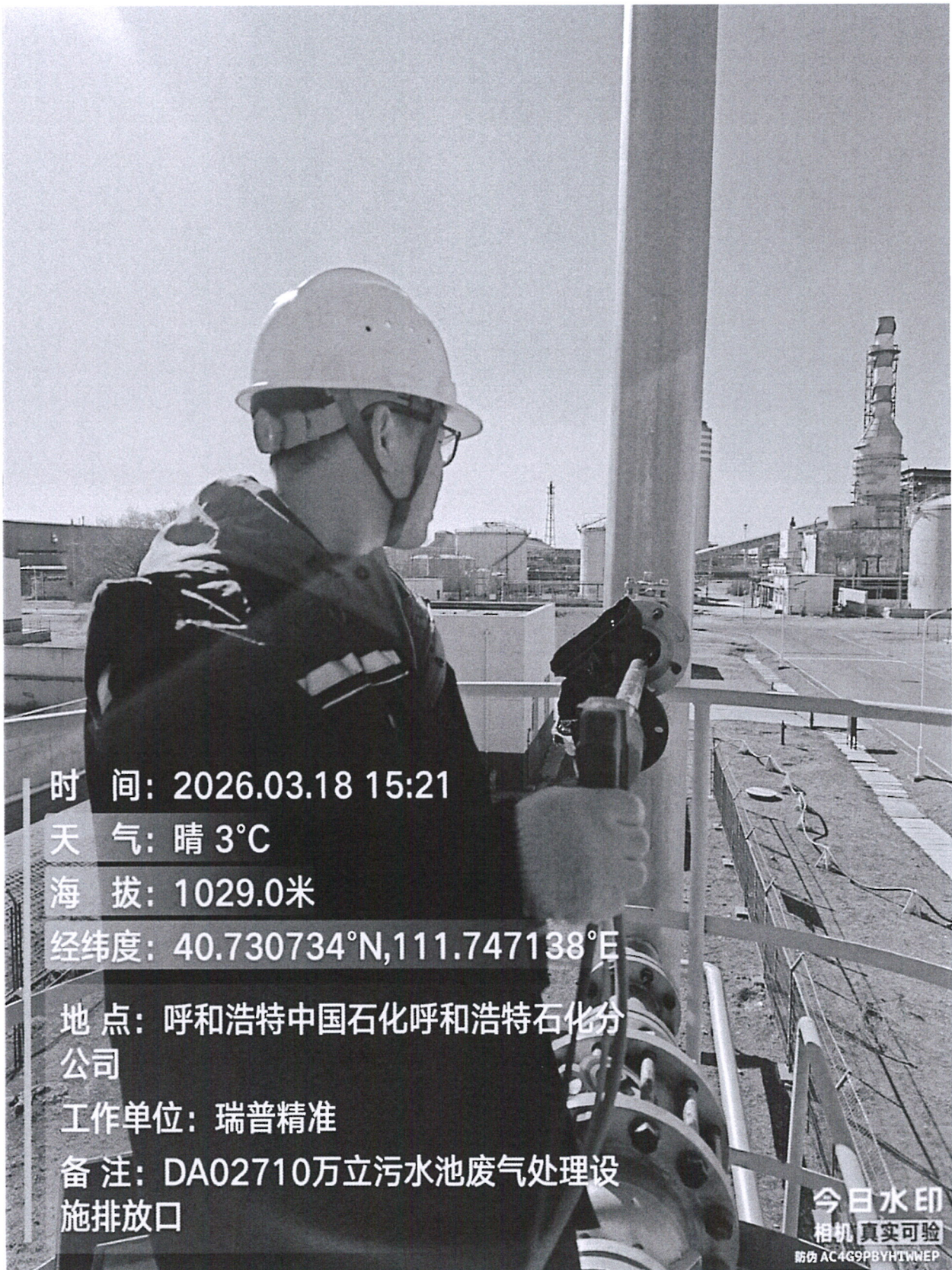
图 1 10 万立污水池废气处理设施排放口采样点位照片