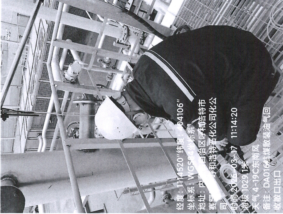
图 1 采样点位照片