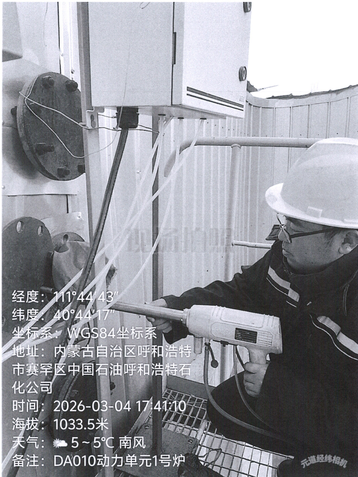
图 1 采样点位照片