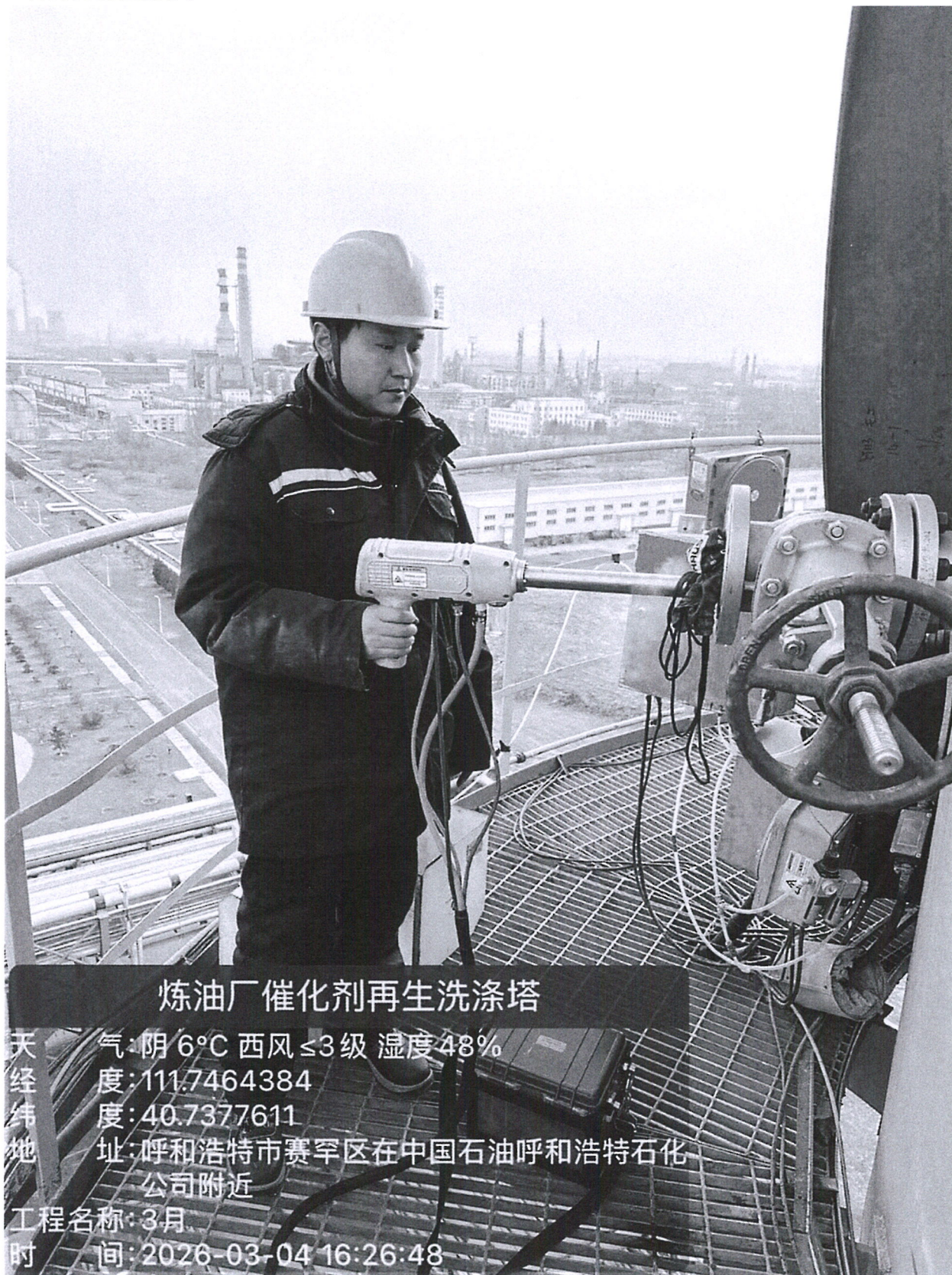
图 1 采样点位照片