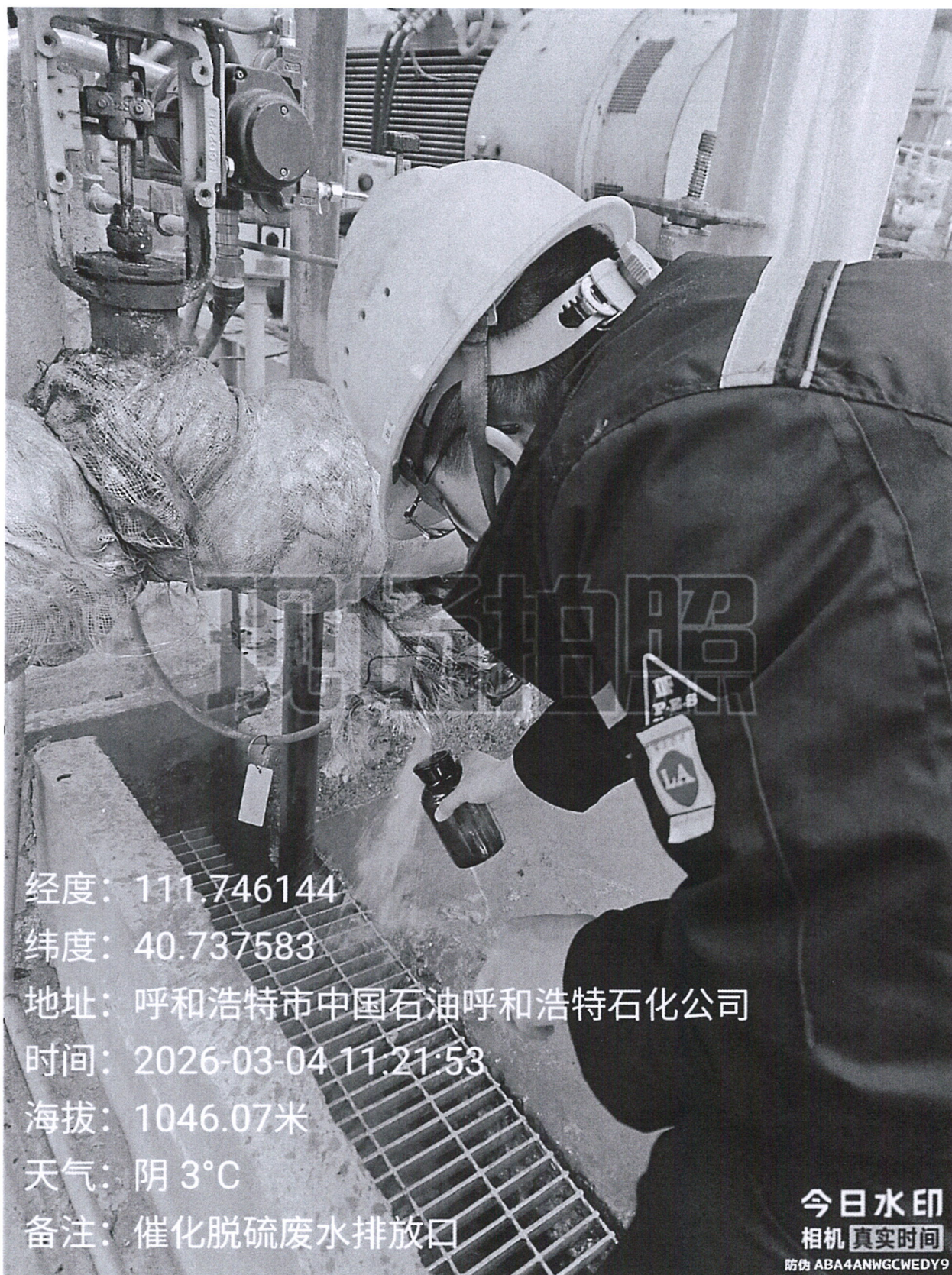
图 1 采样点位照片