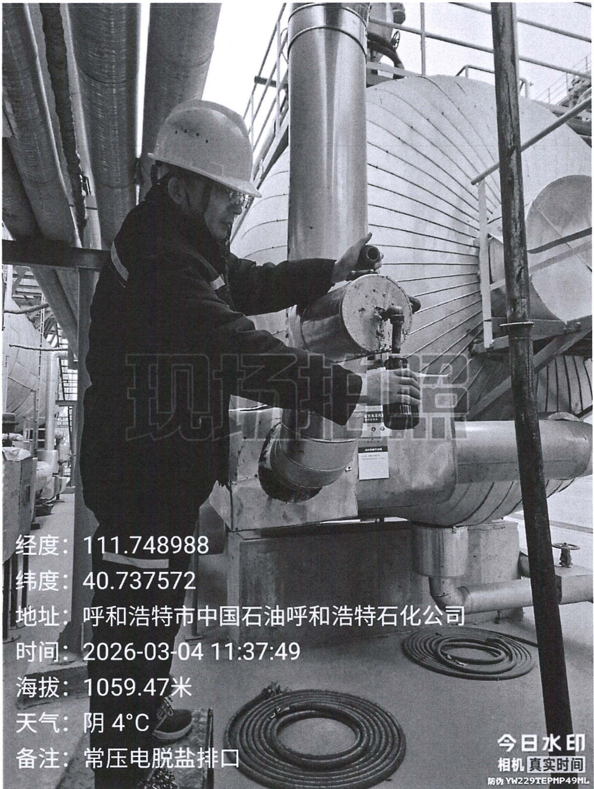
图 1 采样点位照片