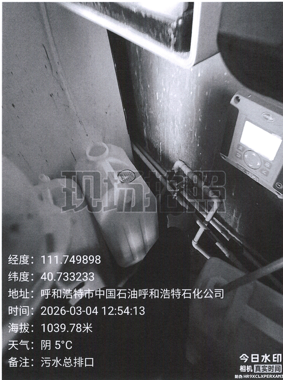
图 1 采样点位照片