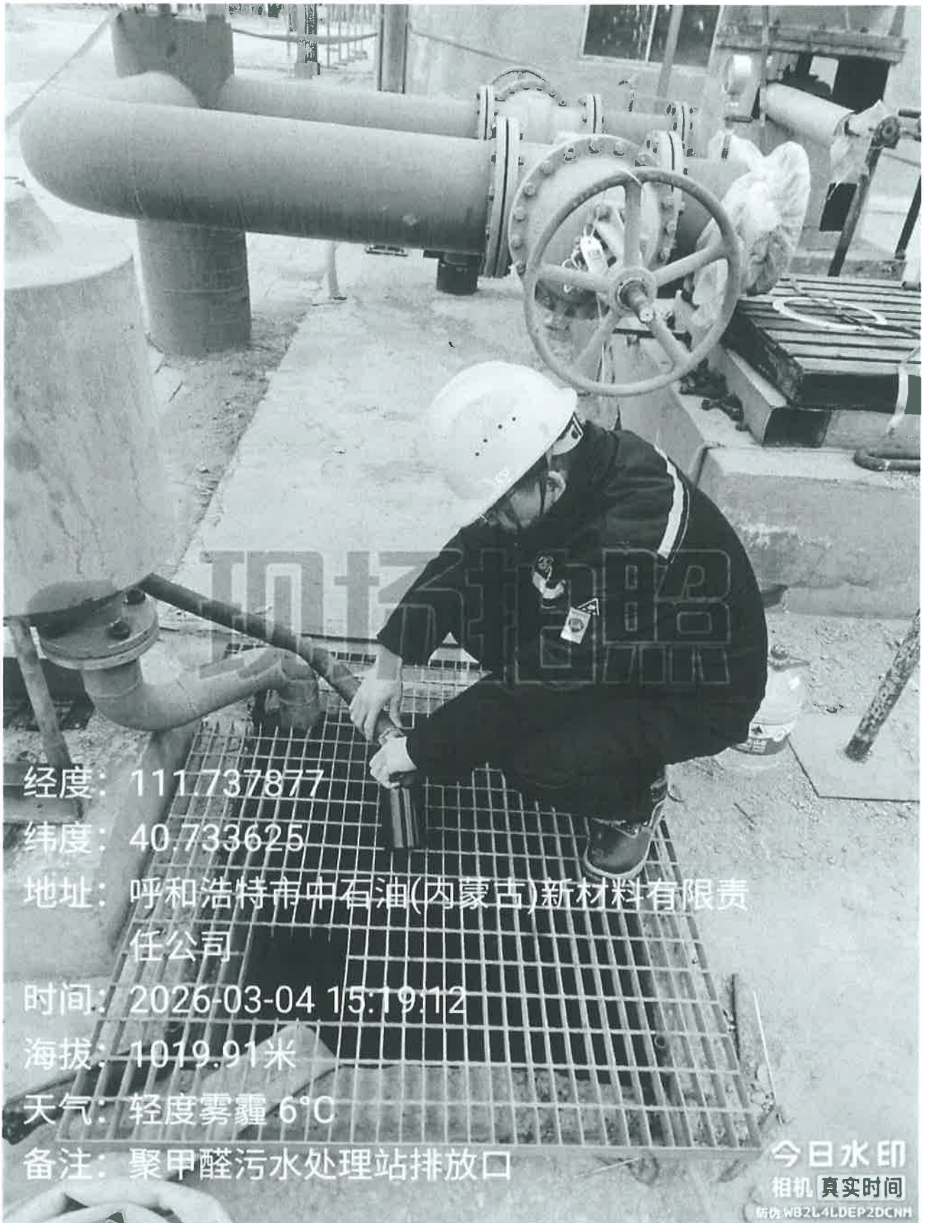
图 1 检测采样点位照片