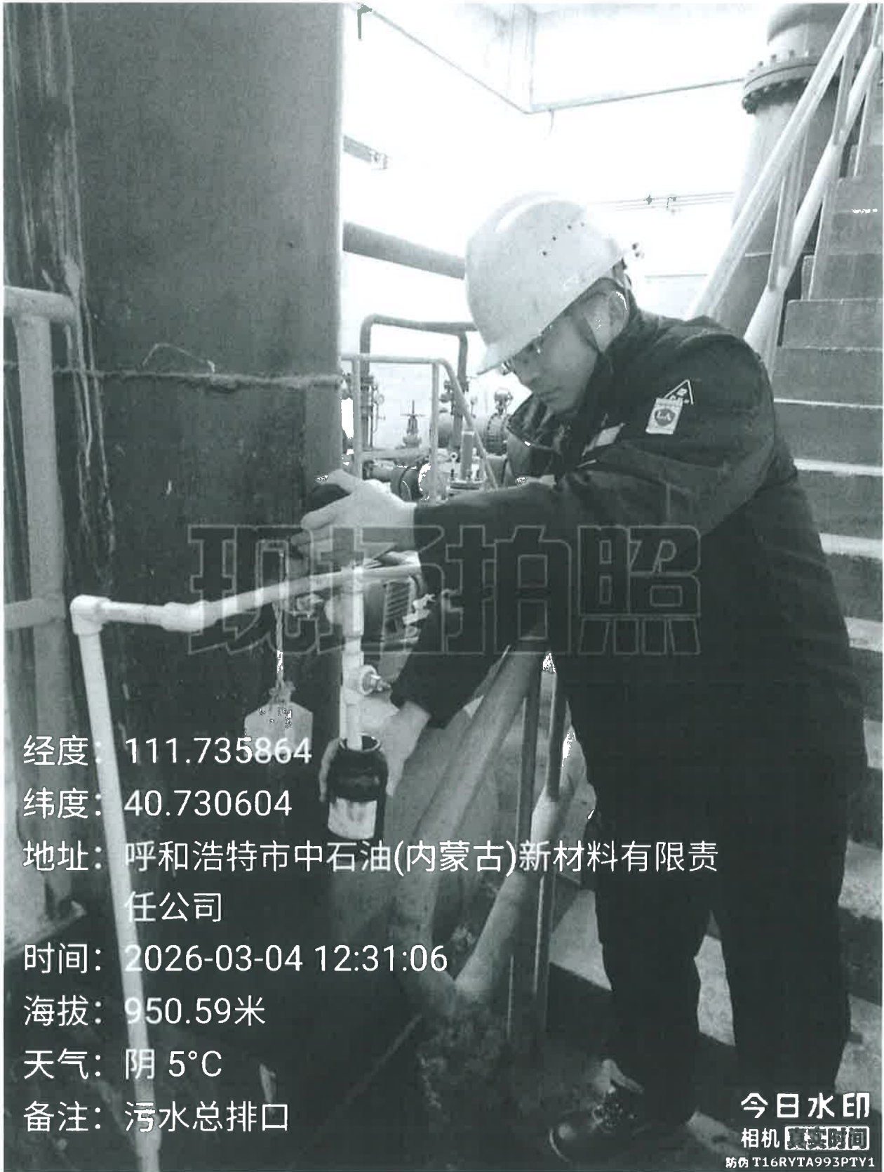
图 1 检测采样点位照片