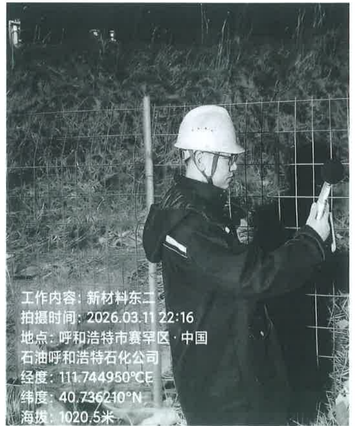
图 1 噪声采样点位照片