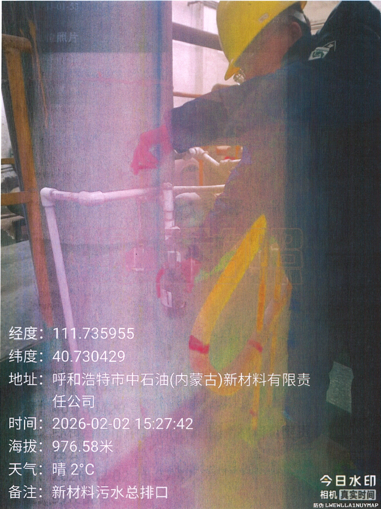
图：检测采样点位照片