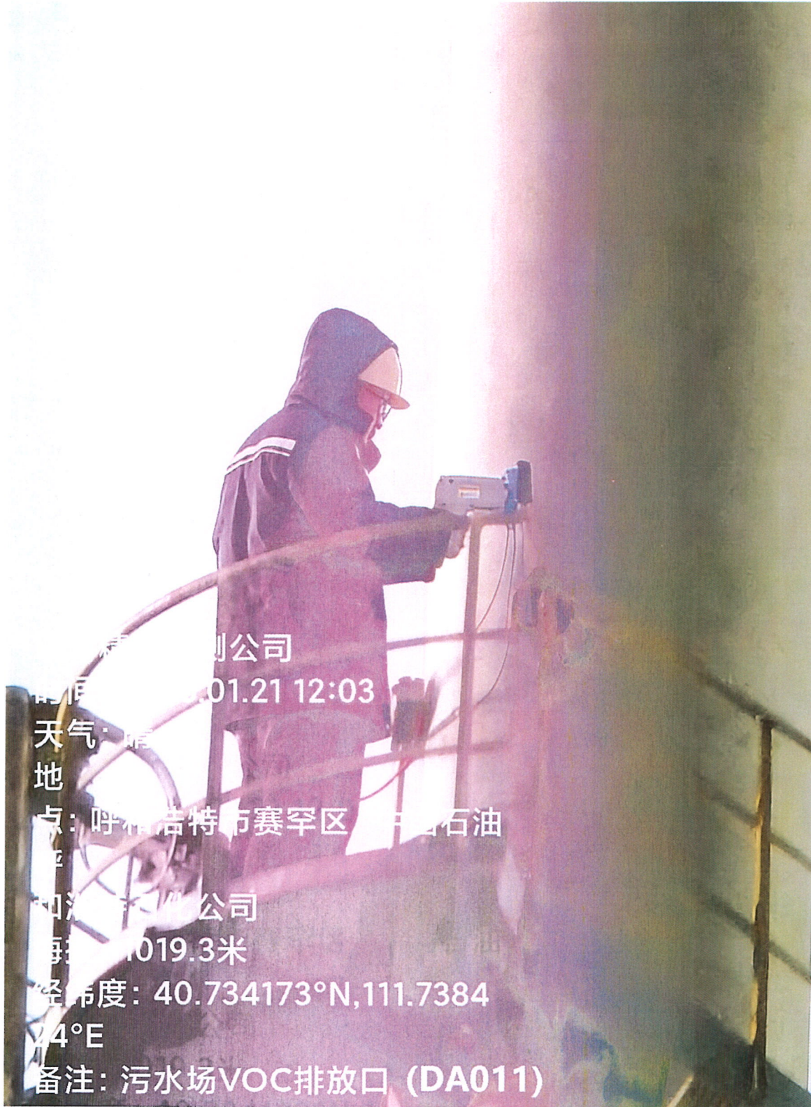
图1 VOC排放口采样点位置照片