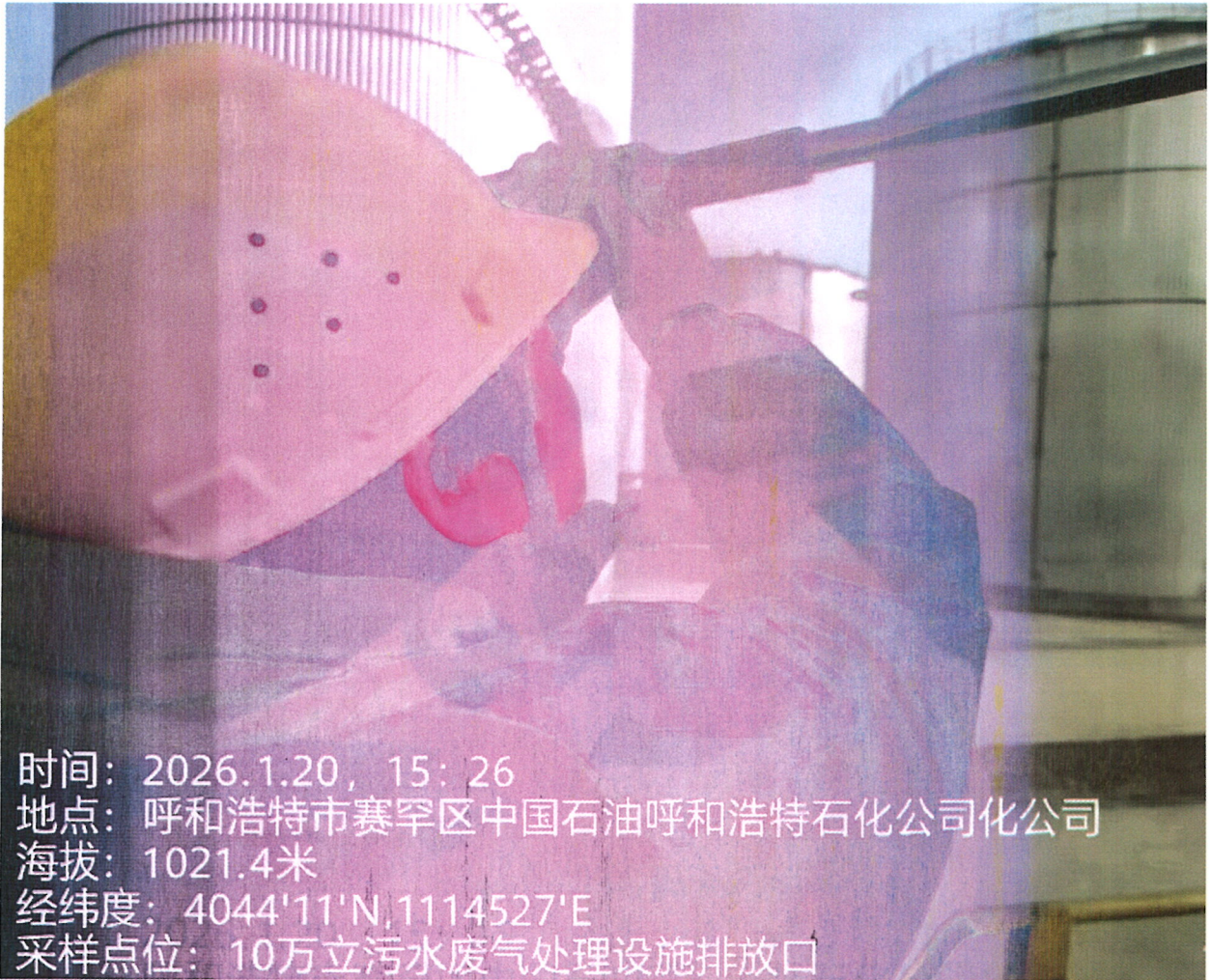
图1 10万立污水废气处理设施排放口采样点位照片