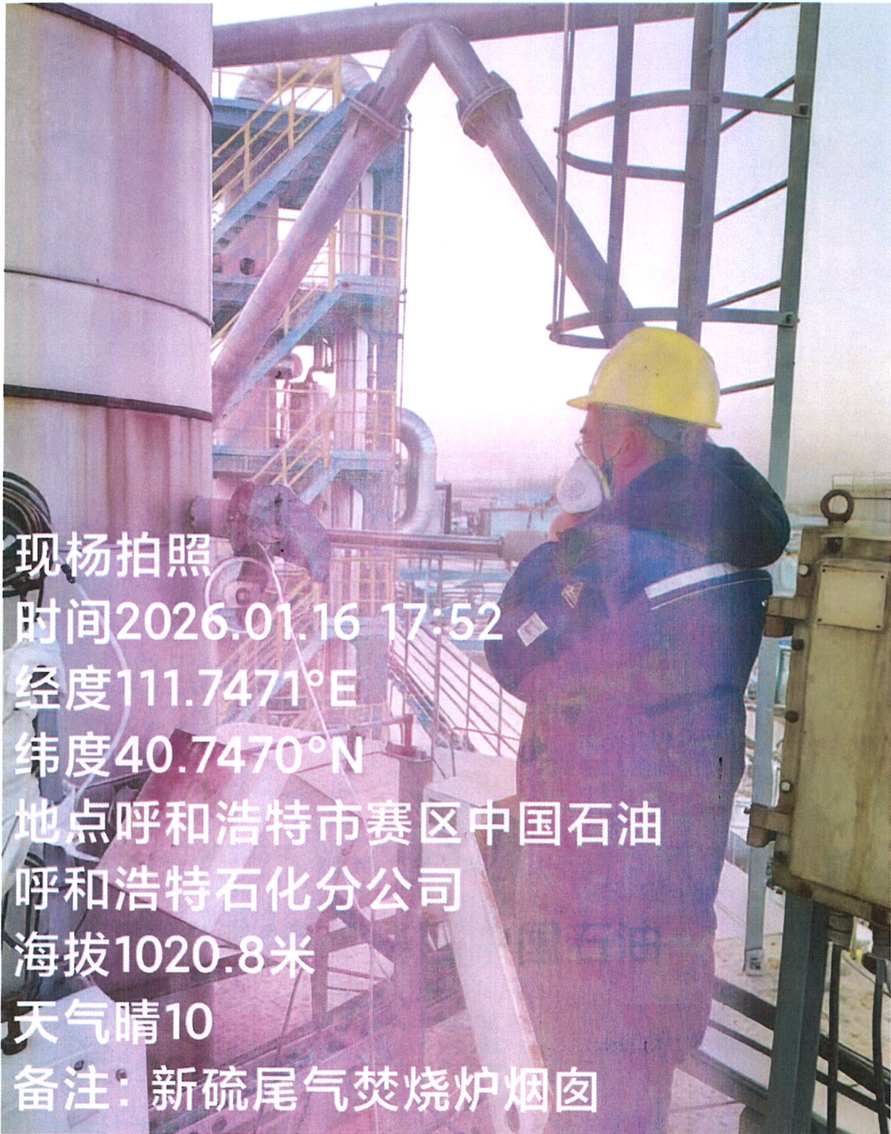
图 1 采样点位照片